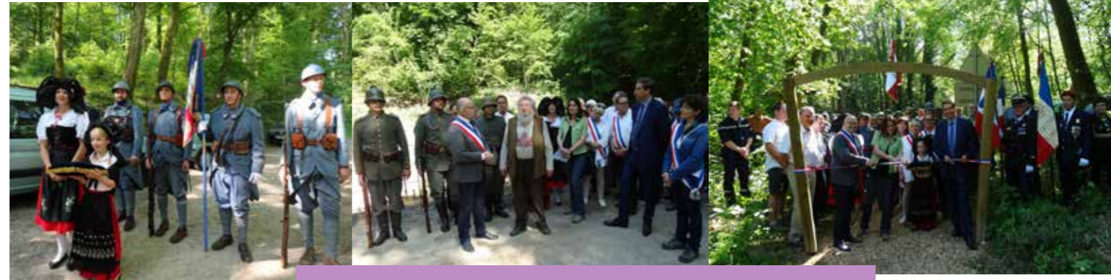
Inauguration du site du Grand Canon réhabilité