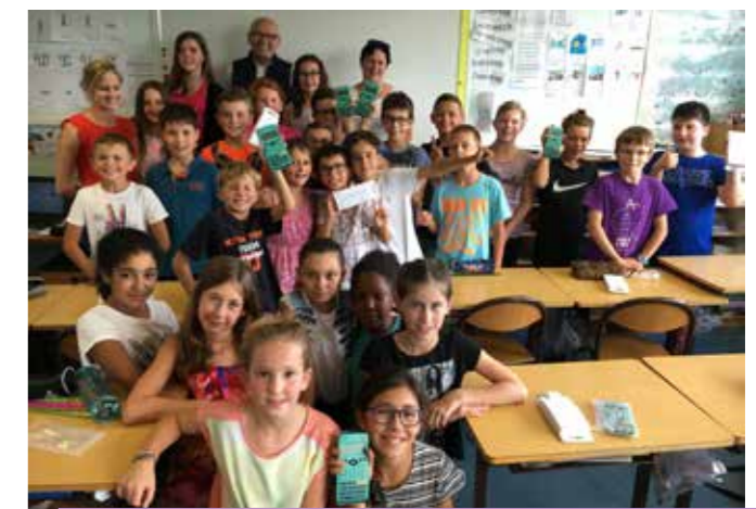
Remise de calculatrices aux élèves de CM2