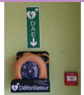
Installation d'un défibrillateur à l'Espace Saint Laurent