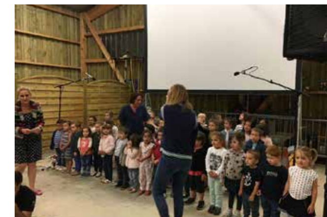
Chants des enfants et projection d'un film élaboré par le Lycée LAMBERT et l'école maternelle