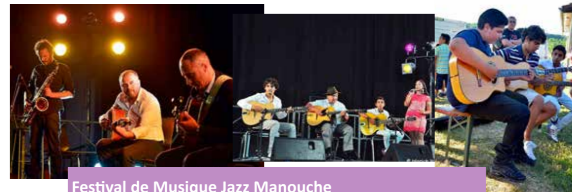
Festival de Musique Jazz Manouche