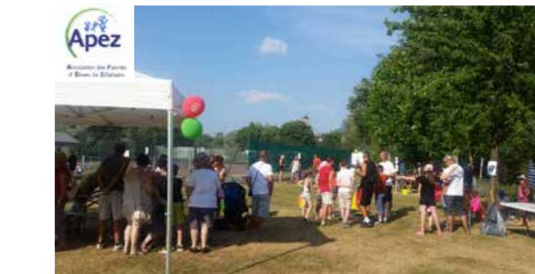
Fête des écoles: l'année scolaire se termine doucement et vendredi 23 juin les enfants ont pu fêter dignement la fin d'année. Tout était réuni pour que cette journée soit réussie ! Au menu : soleil, sourires et danses !