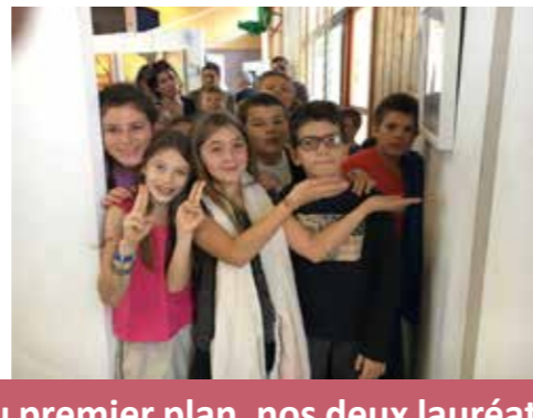
Visite de l'École Élémentaire au Salon International des Arts