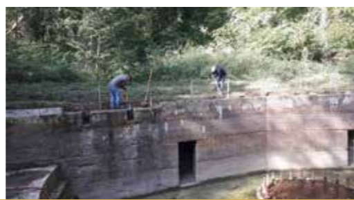
Matinée de travail sur le site du Grand Canon, avec nos bénévoles : travaux d'entretien de la fosse et taille de la végétation environnante pour la propreté du site