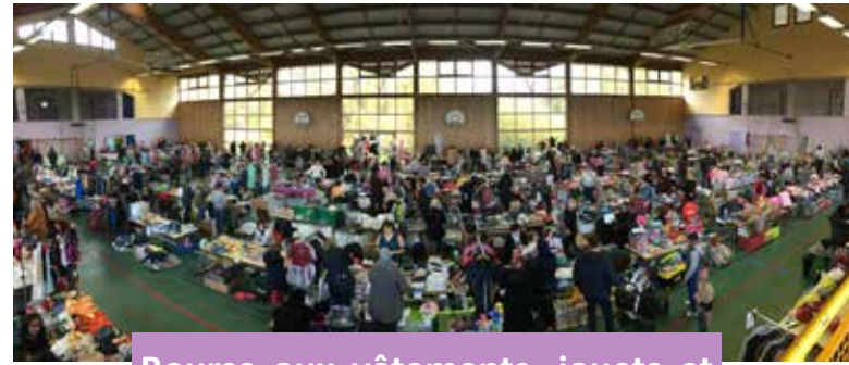
Bourse aux vêtements, jouets et puériculture organisée par l'APEZ