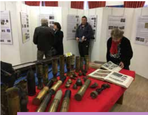
Exposition en mairie dans le cadre du Centenaire