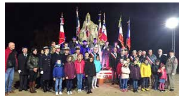
La Commémoration au Monument aux Morts