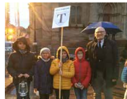
Les élèves de l'Ecole élémentaire ont récupéré la flamme du Souvenir à Mulhouse pour la rapatrier à la Cérémonie de Zillisheim