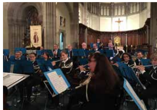
Le concert de l'HARMONIE FANFARE Liberté 1924 de Bruebach