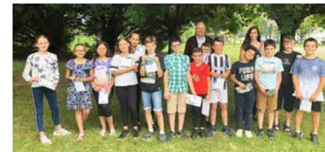
Remise des calculatrices aux élèves de CM2

La nouvelle équipe des Zillisheimois s'est rassemblée, et dans cette année exceptionnelle, celles-ci sont plus que jamais motivées et ont hâte de vous retrouver pour partager de nouveaux événements aussi exceptionnels que surprenants. ALORS VIVEMENT 2021 !